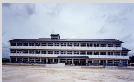
野田市立関宿小学校