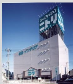
商業施設(ニトリ松戸サニーランド店)