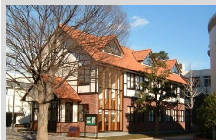
私立高校特別教室