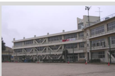
市立中学校(ピタコラム工法)