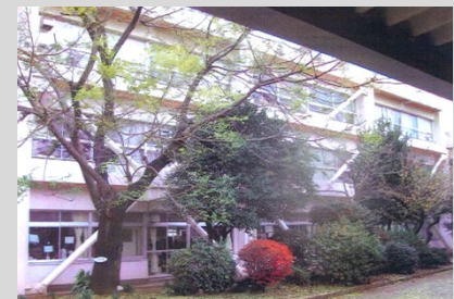
市立小学校(アルミブレース工法)