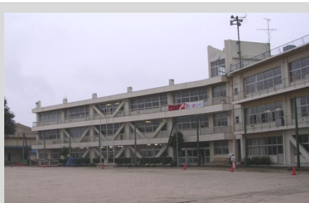
市立中学校(ピタコラム工法)