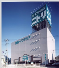
商業施設(ニトリ松戸サニーランド店)