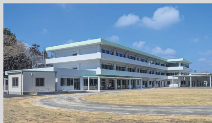
千葉県立東葛の森特別支援学校